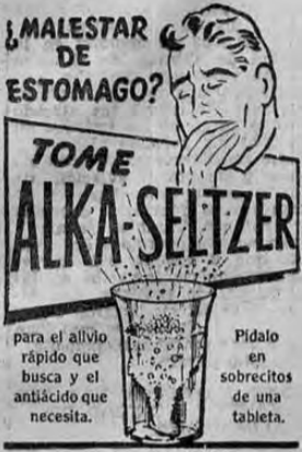
Pídalo en sobresitos de una tableta.